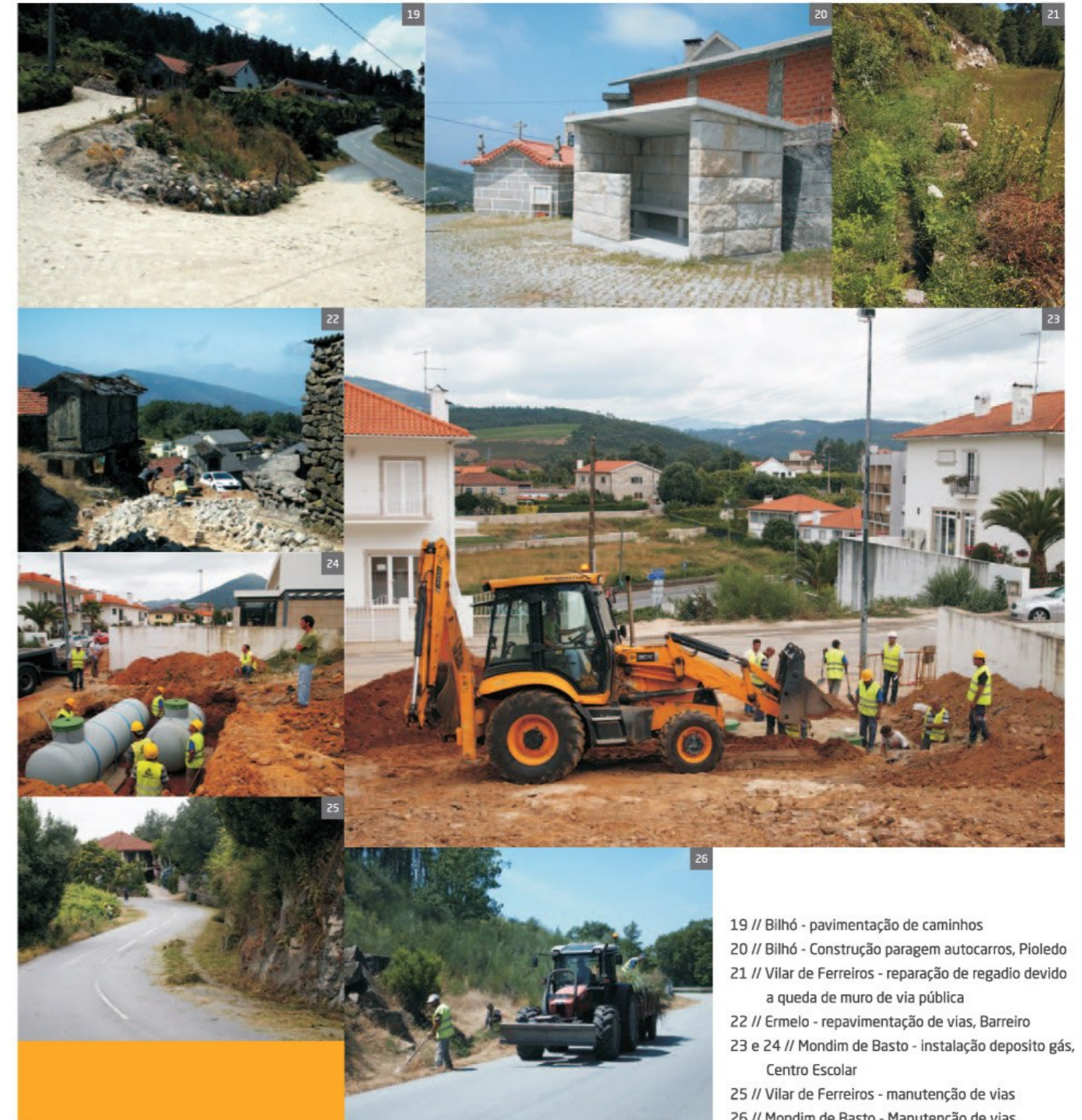
19 // Bilhó - pavimentação de caminhos 20 // Bilhó - Construção paragem autocarros, Pioledo 21 // Vilar de Ferreiros - reparação de regadio devido a queda de muro de via pública 22 // Ermelo - repavimentação de vias, Barreiro 23 e 24 // Mondim de Basto - instalação depósito gás, Centro Escolar 25 // Vilar de Ferreiros - manutenção de vias 26 // Mondim de Basto - Manutenção de vias