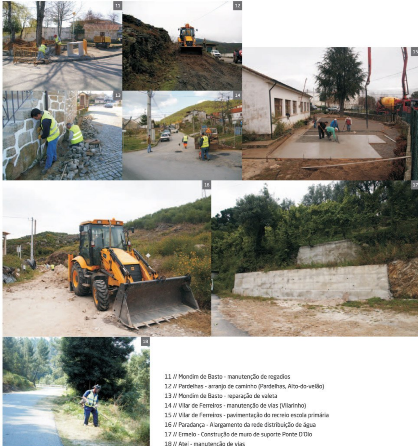
11 // Mondim de Basto - manutenção de regadios 12 // Pardelhas - arranjo de caminho (Pardelhas, Alto-do-velão) 13 // Mondim de Basto - reparação de valeta 14 // Vilar de Ferreiros - manutenção de vias (Vilarinho) 15 // Vilar de Ferreiros - pavimentação do recreio escola primária 16 // Paradaça - Alargamento da rede distribuição de água 17 // Ermelo - Construção de muro de suporte Ponte D'Olo 18 // Atei - manutenção de vias