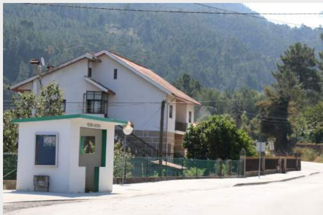
Passeios - Pedra Vedra