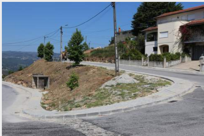
Passeios - Serra