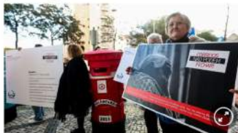
Protesto contra o encerramento de estação dos CTT.

Em declarações à Renascença, Humberto Cerqueira reage ao anúncio de que os CTT vão suspender encerramentos e reabrir postos em alguns concelhos.