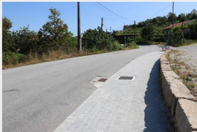
Passeios - Pedra Vedra