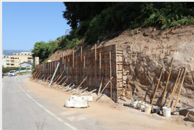
Muro de Suporte e Passeios - Serra