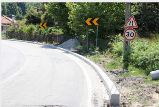
Passeios - Vilar de Viando