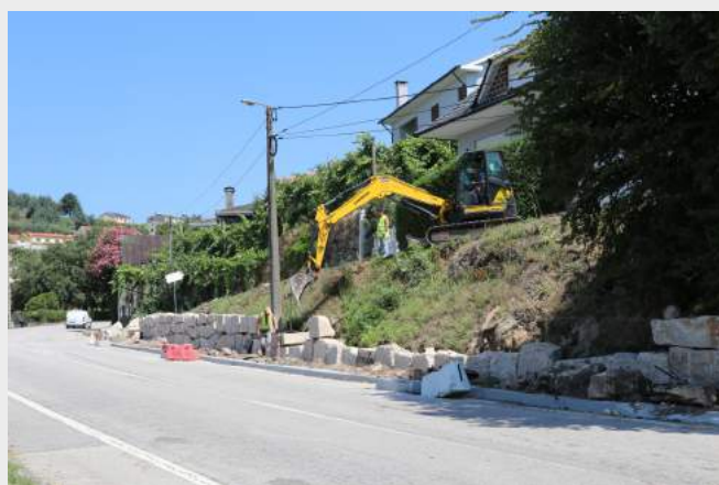
Muro de Suporte e Passeios - Vilar de Viando